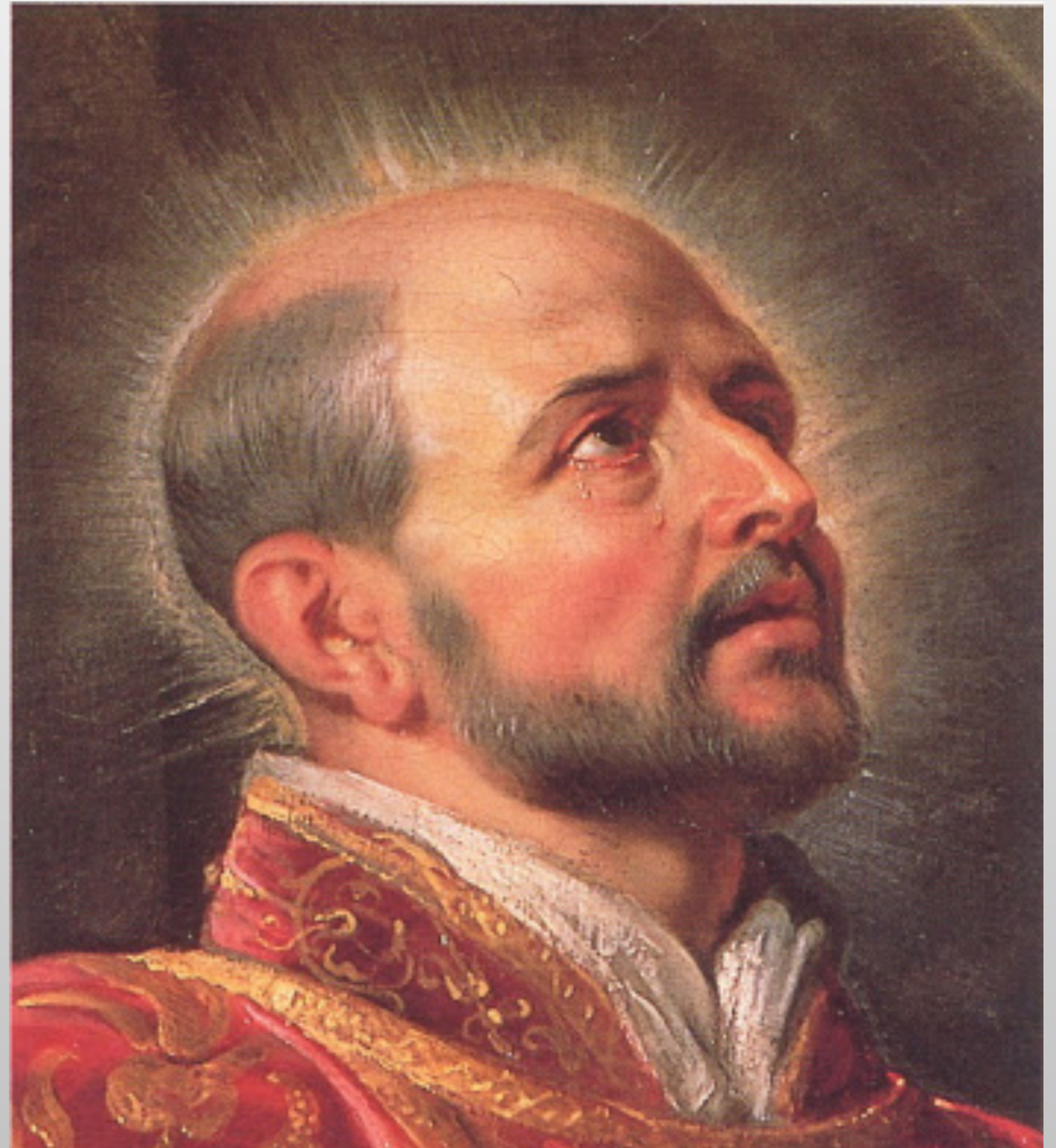
Pieter Paul Rubens, Ritratto di Sant'Ignazio di Loyola

L'arte da sempre svolge la sua principale funzione comunicativa ed in questo contesto è essa ad essere utilizzata per arrivare ai fedeli. La chiesa ha quindi l'obiettivo di trasmettere con forza e decisione sentimenti che riescano a commuovere, a smuovere gli animi della gente, ad EMOZIONARE! Ne consegue quindi che l'iconografia sacra subisce un cambiamento molto forte passando dai canoni estetici rinascimentali ai volti sofferenti del barocco.