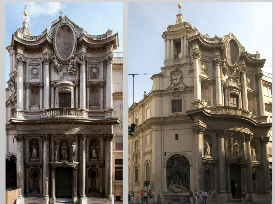
Francesco Borromini - Chiesa di S. Carlo alle quattro fontane